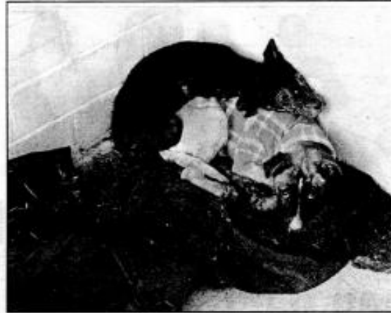
Hasta el momento el dueño de los 72 perros y gatos no se ha presentado a declarar sobre e