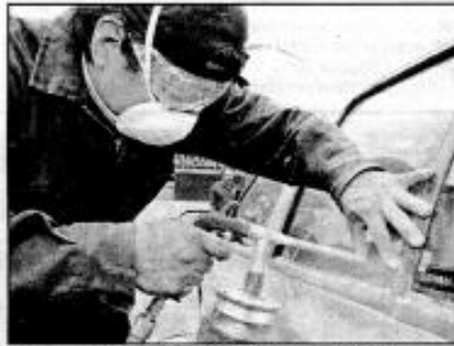
Buscán tatuar gratuitamente autopartes de 5 mil vehículos

pietario del vehículo debe ser residente de Nezahualcóyotl y que el modelo sea de 1990 a 2009, por lo que debe presentar tarjeta de circulación, credencial de elector y comprobante de domicilio; el tiempo para el tatuado de cada auto oscila entre 20 y 25 minutos.