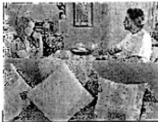
(Fotograma capítulo 216 transmitido el día 22 de junio de 2009)