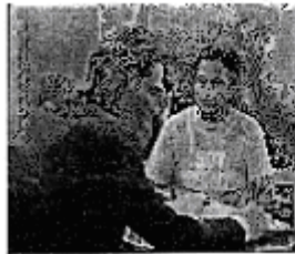
(Fotograma capítulo 216 transmitido el día 22 de junio de 2009)

2. Los días 21, 22 y 23 de junio de 2009 en el canal 2 con clave ‘XEW-TV-2’ (canal de las estrellas), de la empresa Televisa, S.A. de C.V., en las escenas de la telenovela denominada ‘Un gancho al Corazón’ (capítulo 215 ‘ESCOGE’ duración 37:30; 216 ‘CRUEL REALIDAD’ duración 41:35 y el capítulo 217 ‘VENENO’ con una duración: 00:39:15) que se transmite de lunes a viernes a las 20:00 horas se presenta al actor Raúl Araiza con camisetas con la leyenda ‘SOY VERDE’, utilizando la misma tipografía y pantone (sic) combinación de colores verde y blanco del emblema y propaganda del Partido Verde Ecologista de México, como se puede apreciar en las siguientes imágenes tomadas de la página de internet http://www.tvolucion.com/telenovelas/romantica/un-gancho-al-corazon/