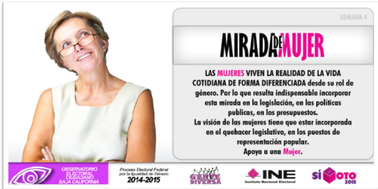
Imagen publicada en periodo 5