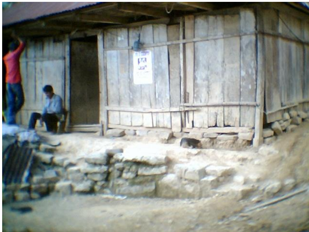
Cartel colocado en viviendas de comunidades indígenas de Ilamatlán, Veracruz.