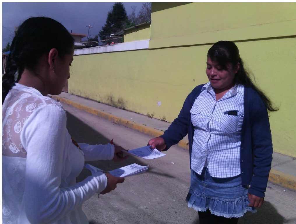
Entrega de trípticos a población indígena Náhuatl. Ilimatlán, Veracruz