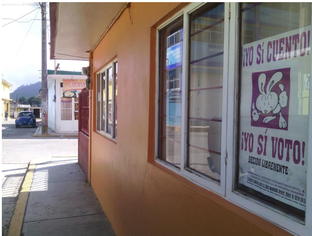
Colocación de carteles en oficinas públicas. Huayacocotla, Veracruz.