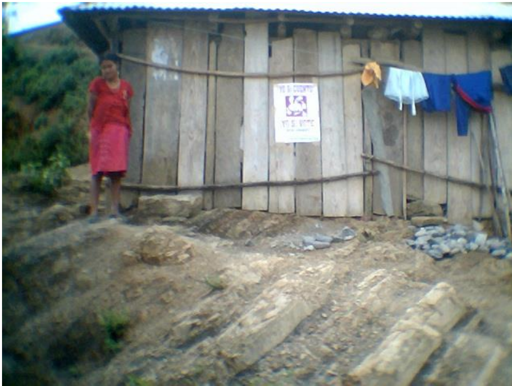
Cartel colocado en viviendas de comunidades indígenas de Zontecomatlán, Veracruz.