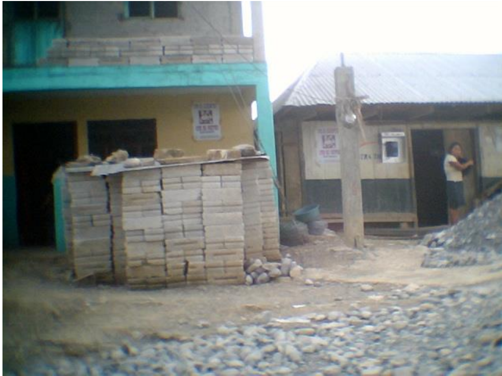
Cartel colocado en viviendas de comunidades indígenas de Benito Juárez, Veracruz.