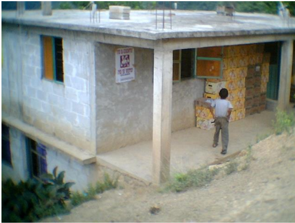
Cartel colocado en tiendas de comunidades indígenas de Texcatepec, Veracruz.