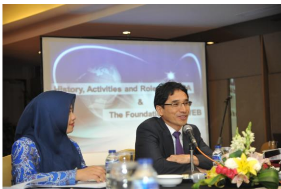
Figura 5 Exposición de Koo Hee Man, Comisión Nacional de Elecciones de Korea.

Asimismo, se recogen a continuación algunos de los comentarios y preguntas que al respecto de la presentación del representante de NEC se hicieron por parte de los otros asistentes al taller: