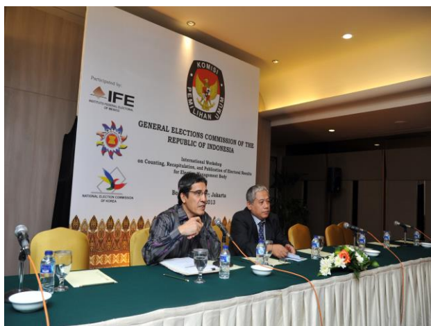
Figura 2 Exposición del Dr. Hadas Nafis Gumay, Comisionado de la KPU

Presentación de la ponencia “ The electoral system. Indonesia’s GEC: main functions and characteristics ” por parte del Dr. Hadar Nafis Gumay, Comisionado Electoral de la República de Indonesia (KPU). Como parte de los aspectos tratados durante la exposición del Dr. Hadar Nafis Gumay, cabe destacar algunos puntos relevantes en relación al sistema electoral de la República de Indonesia: