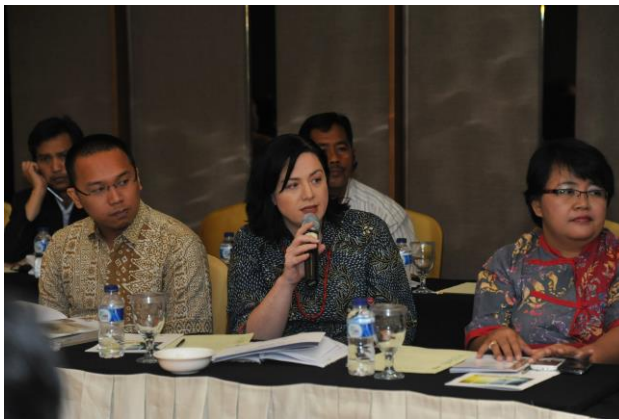
Figura 6 Ronda de preguntas durante la participación del NEC, Corea.