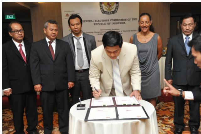
Figura 1 Firma del convenio de colaboración por parte del Presidente de la KPU, Husni Kamil Manik.