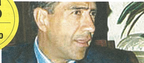
Constancio Carrasco Daza Presidente del TEPJF

El Tribunal Electoral ordenó a los concesionarios de radio y televisión volver a transmitir el spot en que el PAN critica el viaje del presidente Enrique Peña a Londres. La determinación invalida la resolución del INE en el sentido de sacar del aire el promocional porque calumnia al presidente.