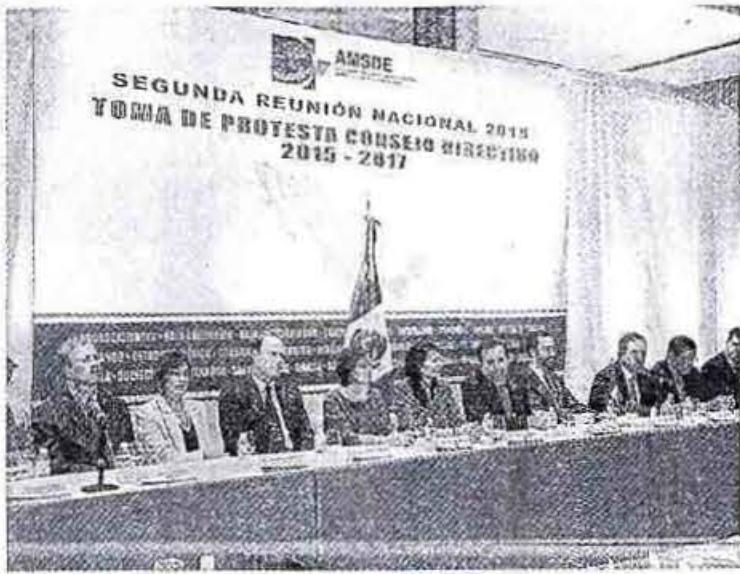
Se llevó a cabo la Segunda Reunión Nacional de la AMSDE.