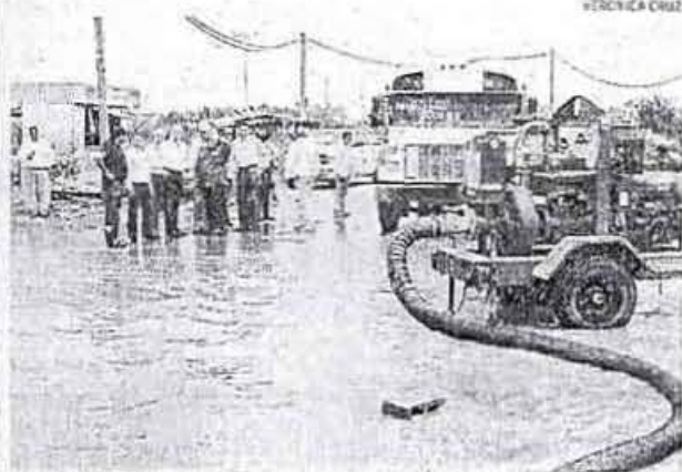
Autoridades hicieron un recorrido para ver afectaciones.

En un par de sectores el nivel del agua alcanzó hasta 60 centímetros de altura