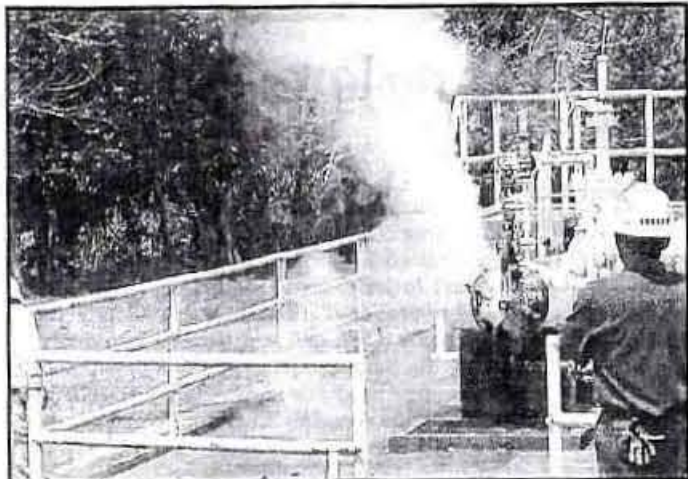
PEMEX INICIARÁ TRABAJOS de limpieza en la red de gas de bombeo neumático en el Campo Tamaulipas.

El procedimiento será realizado con personal y equipo especializado y pretende reducir cualquier riesgo de accidente por falta de mantenimiento.