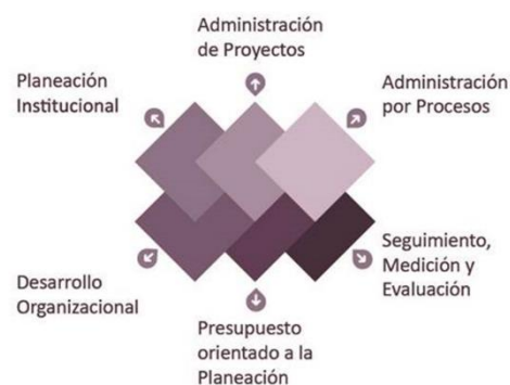
Representación gráfica del Sistema Integral de Planeación, Seguimiento y Evaluación Institucional

El Sistema Integral de Planeación, Seguimiento y Evaluación Institucional 1 (SIPSEI), marco de la planeación institucional, tiene como fin aportar una visión integral de gestión, favoreciendo el uso racional de los recursos institucionales en un entorno de transparencia y rendición de cuentas. A continuación se presentan los seis componentes del SIPSEI: