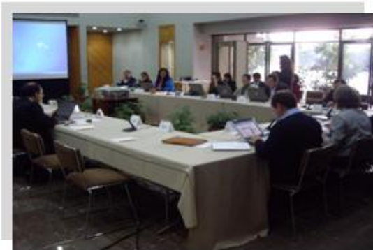
Segunda sesión ordinaria de la Comisión celebrada en el vestíbulo del auditorio del Instituto Federal Electoral.

Por último, en esa segunda sesión ordinaria, se presentó el Informe que contenía una relación de los Convenios celebrados entre el Instituto Federal Electoral y diversas instituciones que efectúan trabajos afines con el tema de discriminación y que se encuentran vigentes.