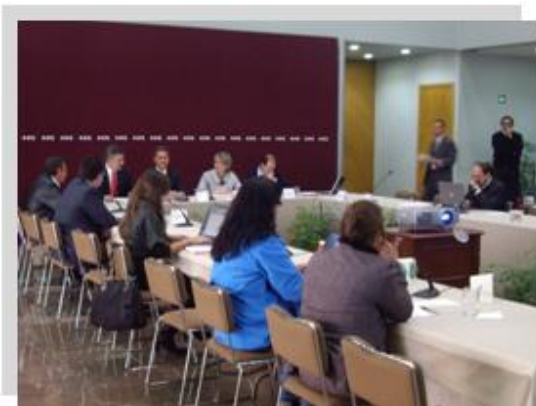
Segunda sesión ordinaria del 23 de septiembre de 2008

comunicación con el Secretario Ejecutivo para brindar la atención que en su caso corresponda a dichas cuestiones.