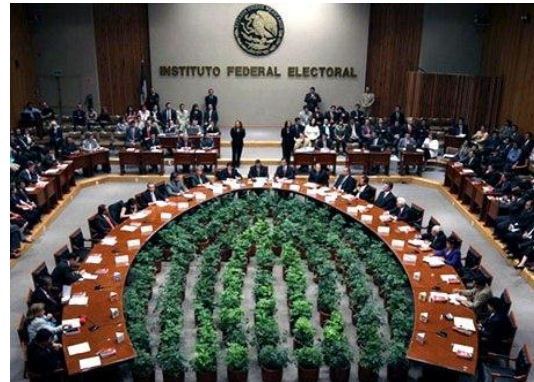
Vista panorámica del Consejo General del Instituto Federal Electoral con la nueva integración e incorporación de los Consejeros Electorales designados de conformidad al decreto publicado en el Diario Oficial de la Federación de 26 de junio de 2008.