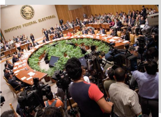
Vista panorámica del Consejo General del Instituto Federal, con la integración previa al 15 de agosto de 2008.

El Consejo General del Instituto Federal Electoral por acuerdo CG291/2008 aprobado en sesión extraordinaria del 27 de junio de 2008, publicado en el Diario Oficial de la Federación el 16 de julio de 2008, decretó la creación de la Comisión Temporal para la elaboración de un Programa Integral en contra de la discriminación y a favor de la equidad laboral y de una cultura democrática en el Instituto Federal Electoral.