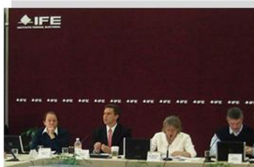
Consejeros Electorales integrantes de la Comisión y Secretario técnico.

En razón de todas las observaciones efectuadas a la encuesta, se acordó presentar una nueva propuesta elaborada por el Secretario Técnico, para que atendiendo a las sugerencias realizadas, presentara ante los integrantes de la Comisión una segunda versión. Por lo anterior se pidió a los integrantes que hicieran llegar por escrito sus observaciones a más tardar el viernes 24 de octubre del año en curso.