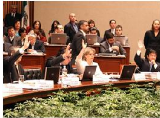
Consejo General del Instituto Federal Electoral sesión ordinaria del 29 de octubre de 2008