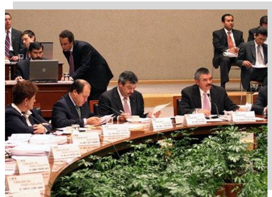
Sesión extraordinaria del Consejo General del Instituto Federal Electoral del 14 de agosto de 2008

Un acuerdo relevante adoptado por los miembros de la Comisión en la primera sesión ordinaria consistió en que la celebración de las subsecuentes sesiones se realizarían en el vestíbulo del auditorio del Instituto Federal Electoral, hasta en tanto no existieran las condiciones físicas de las instalaciones para el fácil acceso y desplazamiento de las personas con discapacidad física.