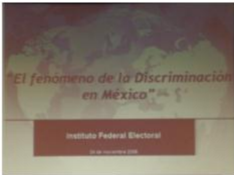
Plática de sensibilización "El fenómeno de la Discriminación en México"