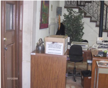
Urna instalada en la Junta Local Ejecutiva en el Estado de Chihuahua

Expuso también el mecanismo a realizar para aquellas personas que no tengan acceso a una computadora o prefieran contestar por escrito, en donde se podrán solicitar los formatos a la Dirección Ejecutiva de Capacitación y Educación Cívica DECEyEC y a las vocalías de Capacitación electoral y educación cívica de los órganos desconcentrados, contestarlos y depositarlos en la urna que para tal efecto se implementará.