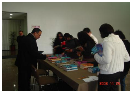
Mesa de la CONAPRED colocada en el vestíbulo del Auditorio del IFE obsequiando las publicaciones en materia de discriminación.