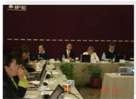
Tercera sesión ordinaria de la Comisión

En este sentido las observaciones recibidas por el Secretario Técnico consistieron en: cambiar la redacción de la primer pregunta por un enunciado más sencillo; solicitaron incluir un lenguaje de género en las preguntas, así como separar las preguntas que contenían doble reactivo; propusieron eliminar los datos de edad, sexo y área de adscripción, sugirieron incluir preguntas para saber si discriminan más los hombres o las mujeres y si se ha sufrido de alguna muestra de discriminación en juntas locales, distritales o en alguna vocalía en particular.